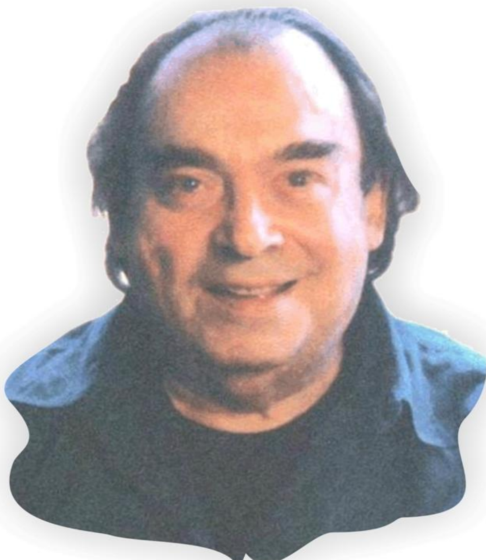
ЗАХОДЕР БОРИС ВЛАДИМИРОВИЧ (1918-2000)