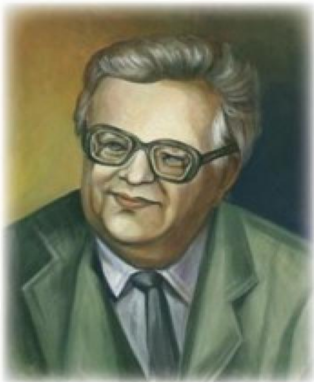
Берестов Валентин Дмитриевич (01.04.1928-15.04.1998)