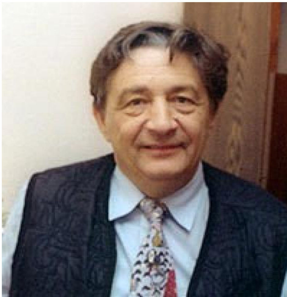
Эдуард Николаевич Успенский (1937 г.)