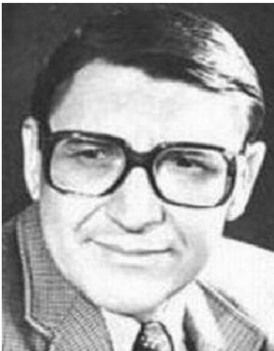
Евгений Серафимович Велтистов (1934-1989)