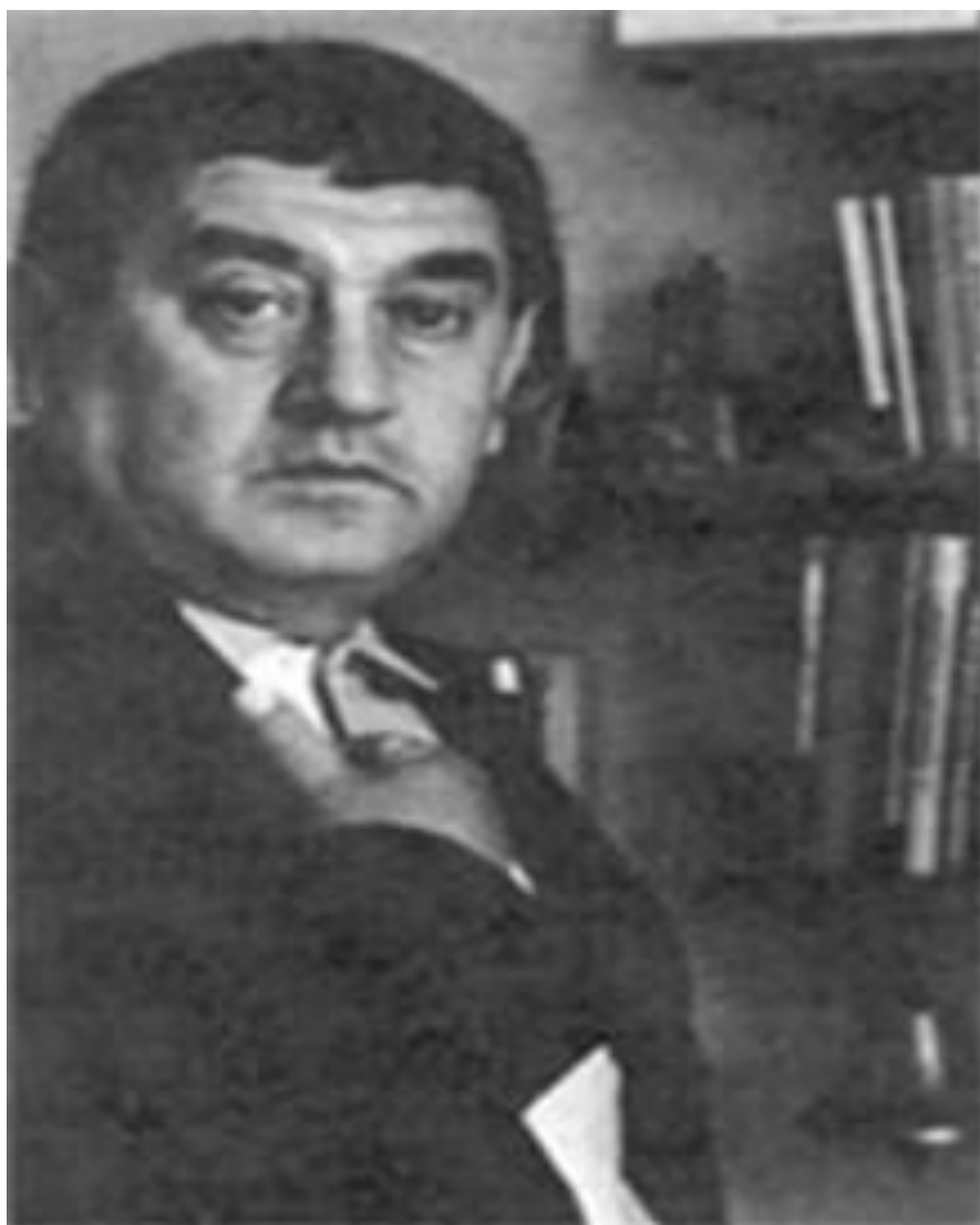
Виктор Юзефович Драгунский (1913-1972)