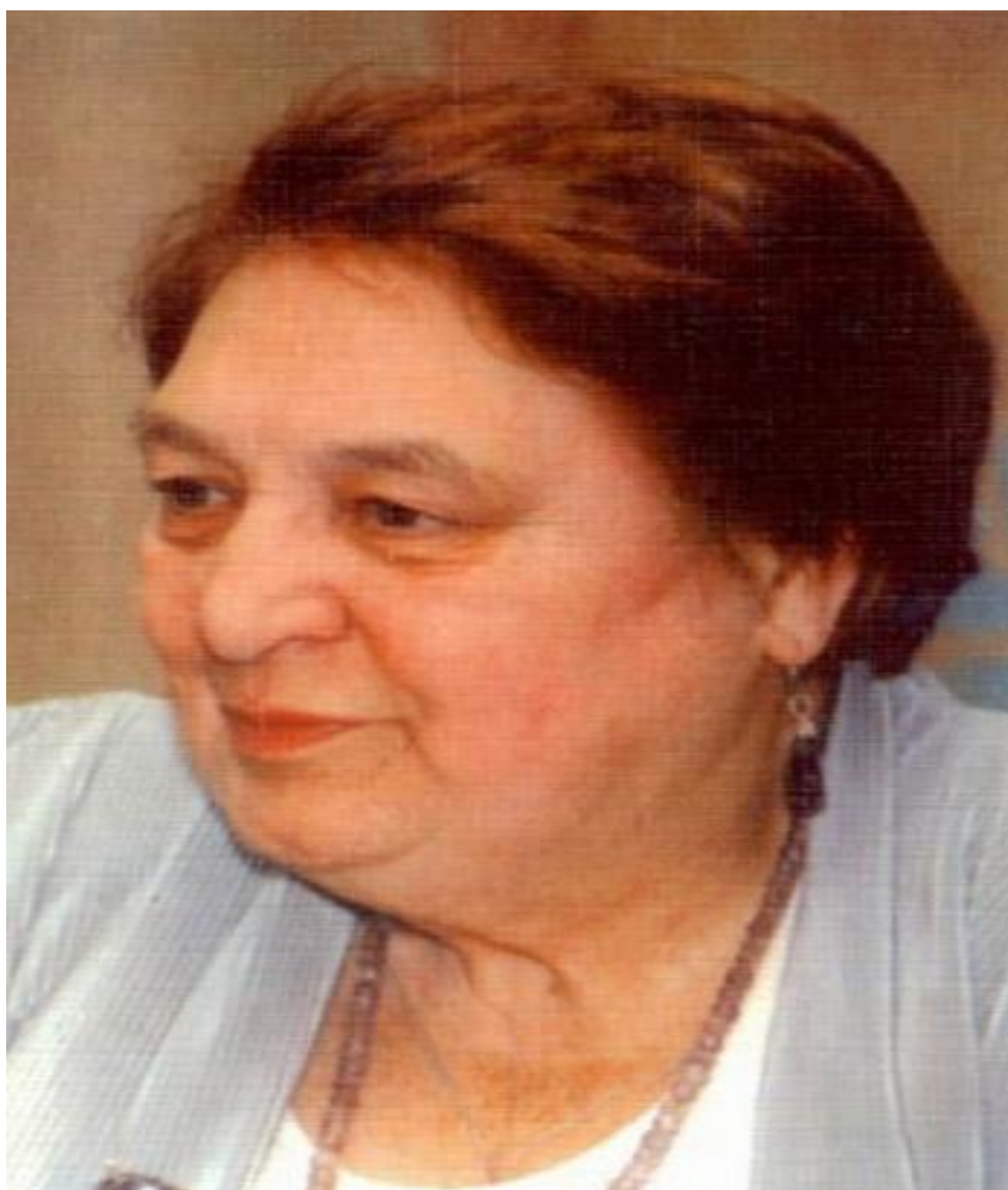
Ирина Петровна Токмакова (1929 г.)