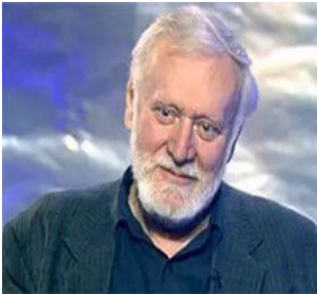
Кир Булычев (1934-2003)