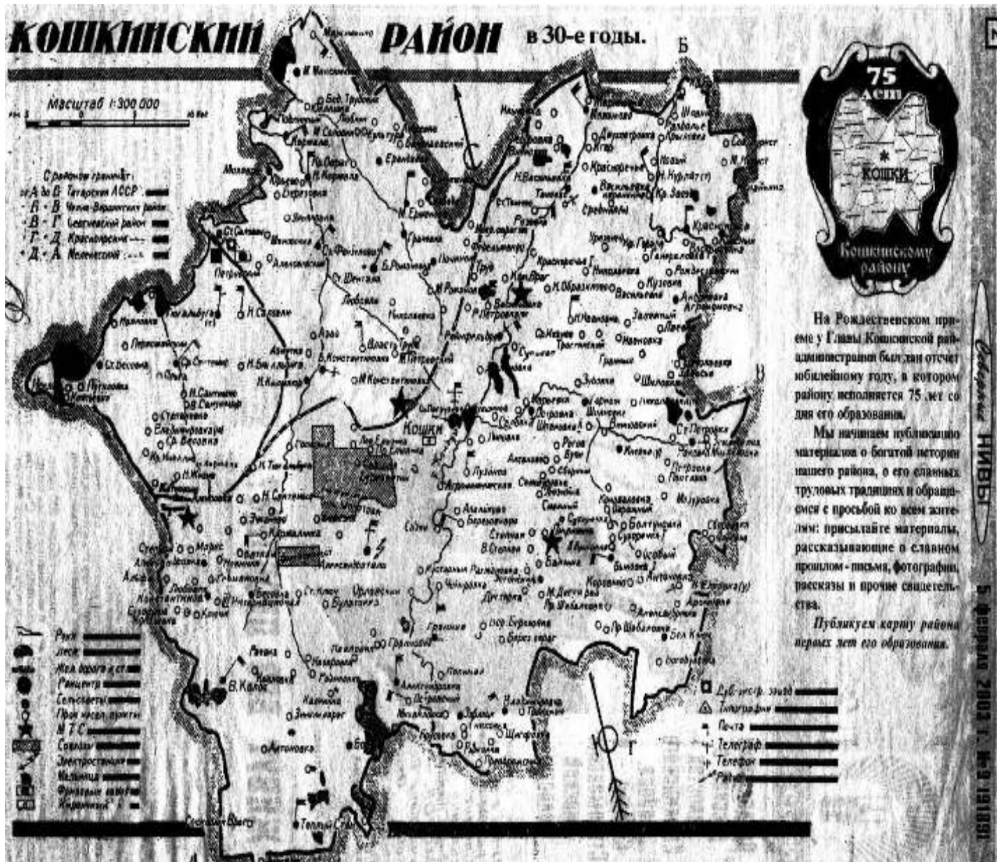
Прил.1 Кошкинский район в 30-е годы.