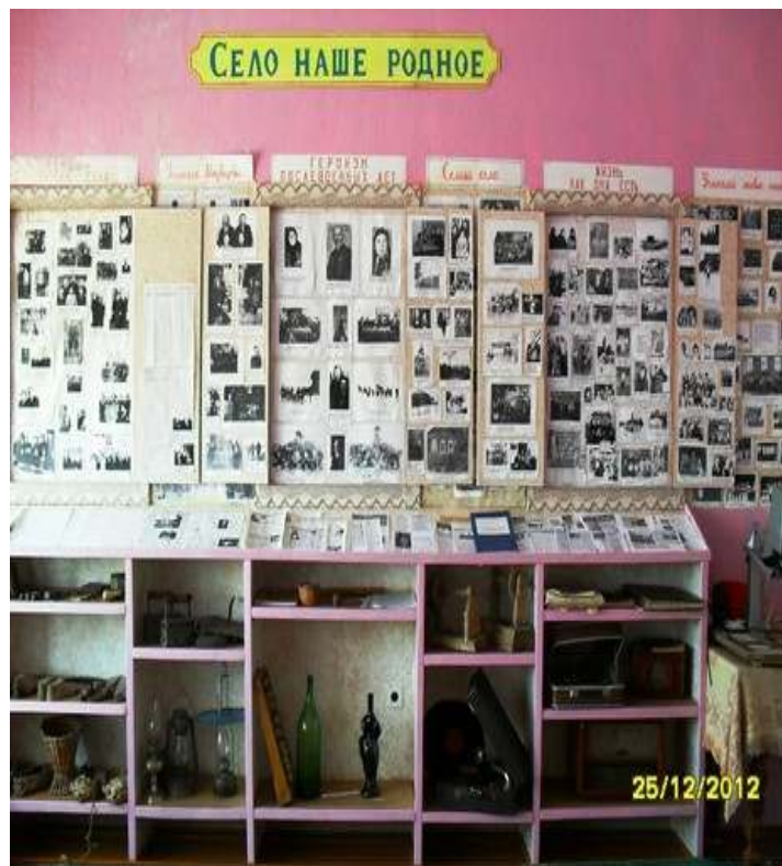
Прил.10. Сельский музей.