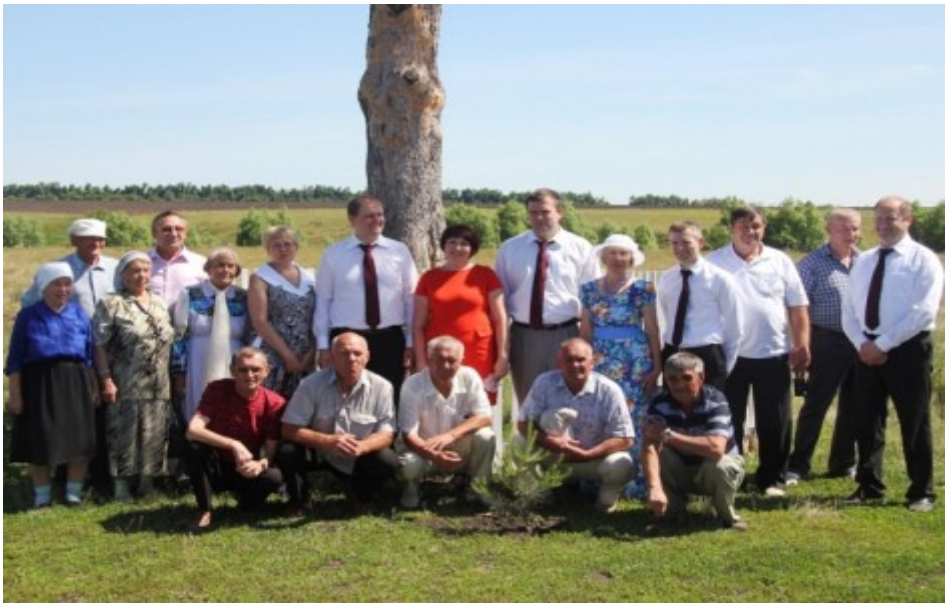
Прил.8 Встреча односельчан на Троицу.